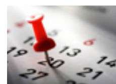
REGATTAKALENDER 2016 JENS HOLSCHER